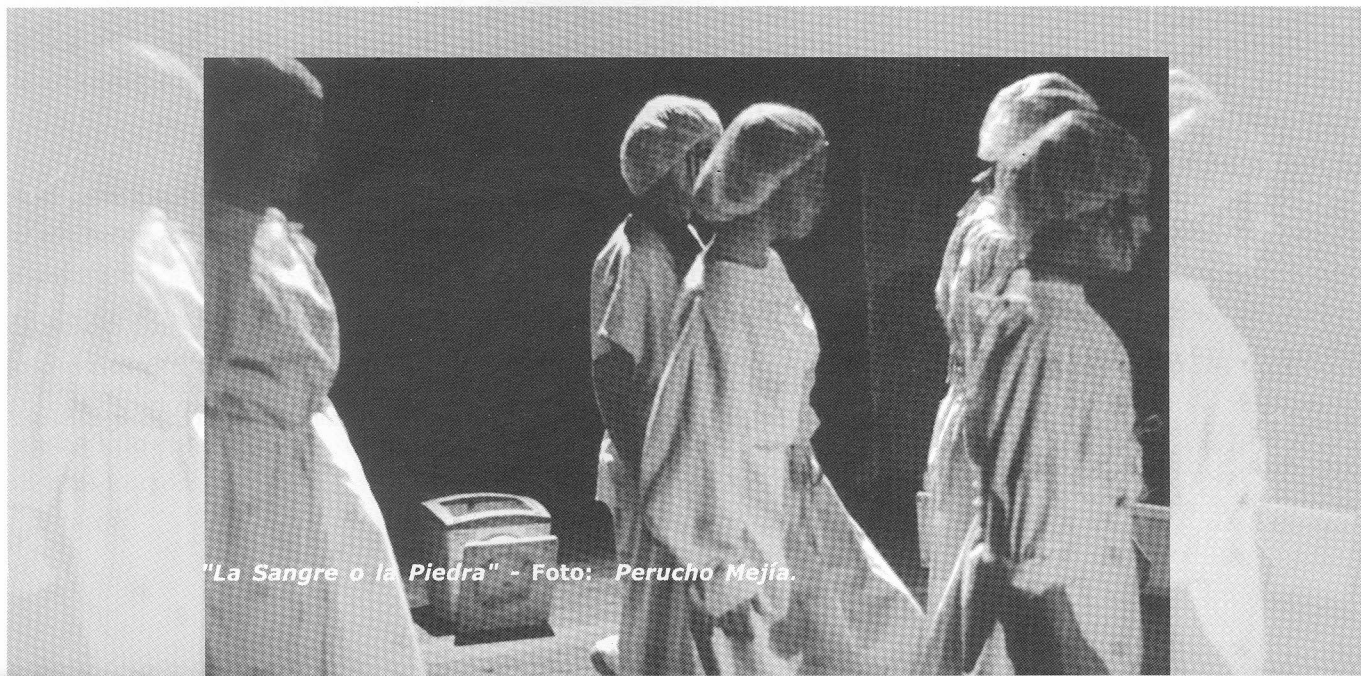
"La Sangre o la Piedra"