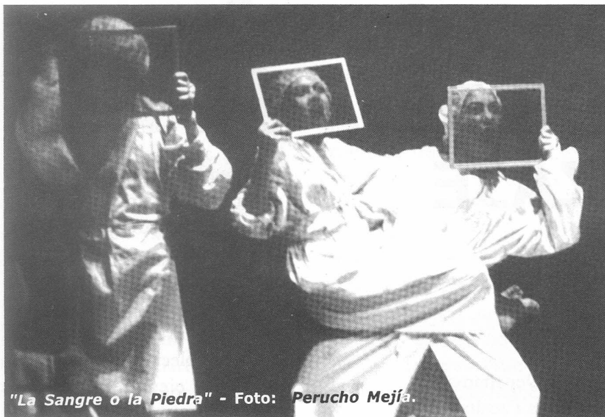
"La Sangre o la Piedra"