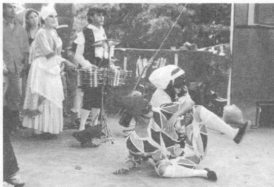
Obra: «Casos del amor y otros demonios» Comedia del Arte. V Semestre

ra. Tenemos entonces un cuerpo del actor que habla y un lenguaje corporal que es un «...sistema de signos que se constituyó a partir de combinaciones lógicas y puramente formales, de un número pequeño de elementos, de acuerdo con reglas derivadas de la realidad tal como pudo ser observada e imaginada en un momento dado». 2