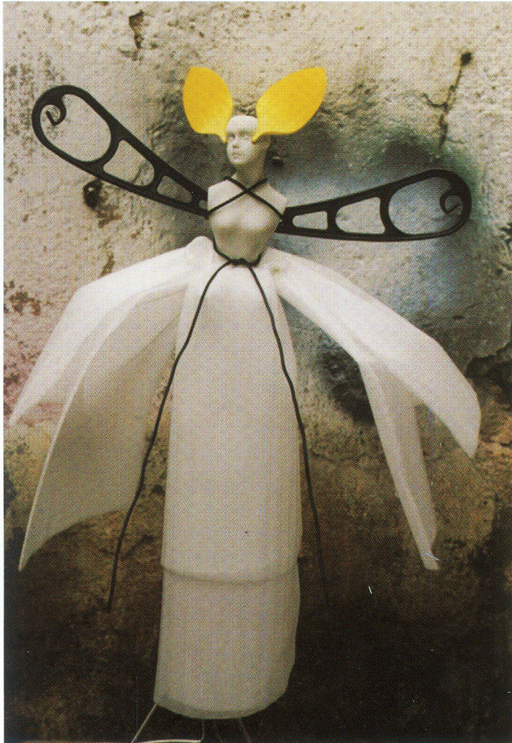
Obra: Hadas / Fotografía: Maija Tuurna