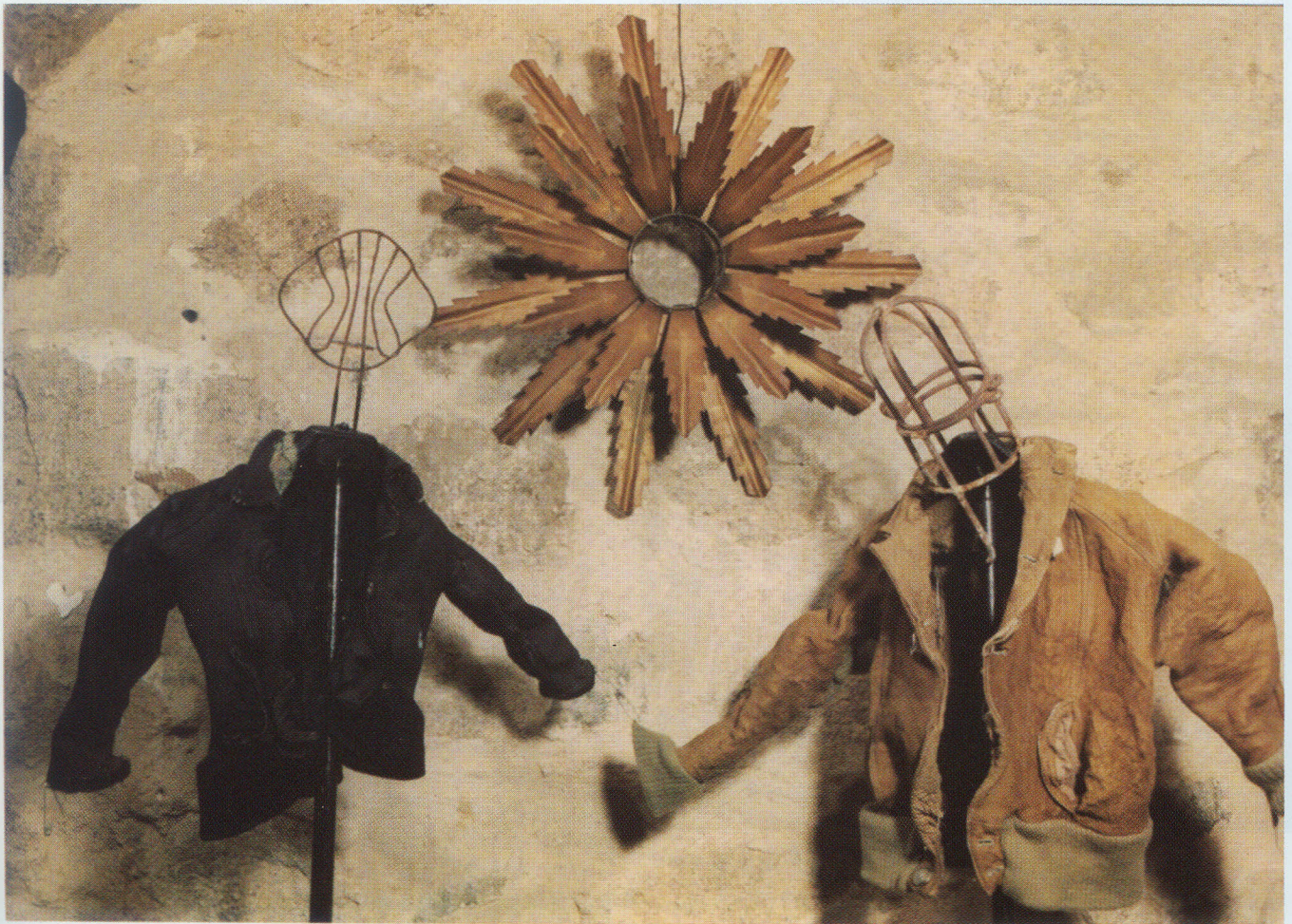
Obra: Nosotros

La Escuela de Teatro afincada al Conservatorio de Música se hubiera podido fundar en 1936, cuando la gran interprete lorquiana Margarita Xirgu visitó Cali con motivo de su gira por esta parte del continente. Antonio María Valencia, "ya la había visto en Bogotá en La Dama Boba de Lope de Vega". En esa ocasión anotó en el programa de mano: "Esa noche marcó en mi vida un sentido insospechado del mundo y de la criatura humana".