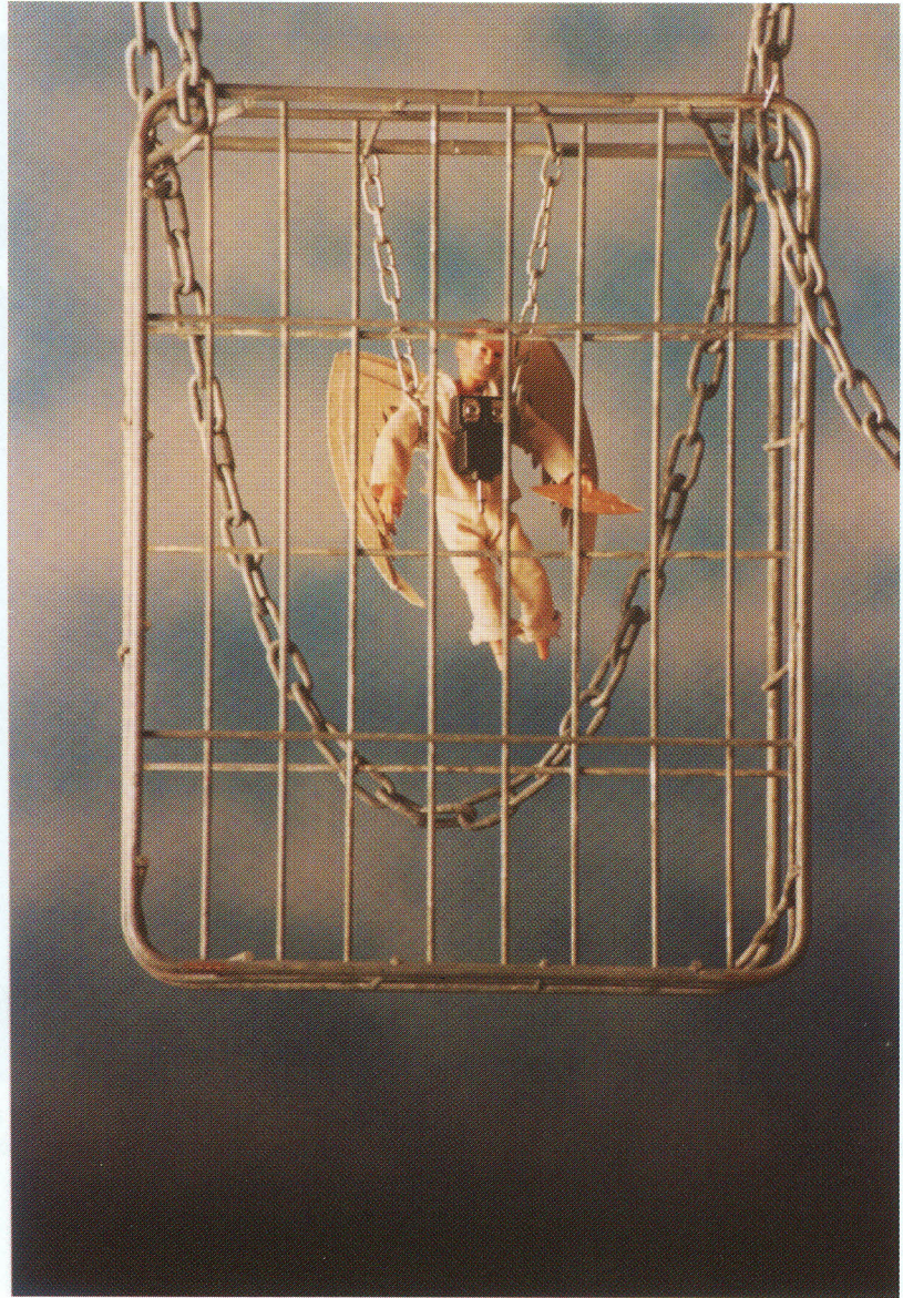
Obra: Solitud