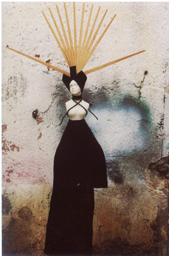
Obra: Hadas